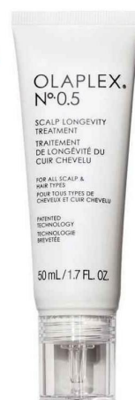
N° 0.5 Scalp longevity treatment, 43 € (50 ml) , Olaplex, (en exclusivité chez Sephora).