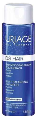
Shampooing doux équilibrant DS Hair, 9,75 € (200 ml) , Uriage.