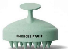
Brosse massante cuir chevelu, 10,49 € , Énergie Fruit.