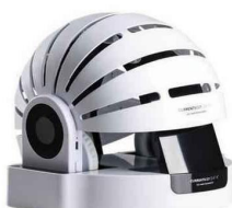
Casque leds repousse cheveux 739,99 € , CurrentBody.